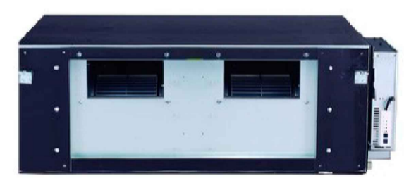
U.I KOSNER KRV CD 200T DC 2.0 (Fuera de proyecto)