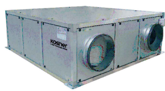
RECUPERADOR KOSNER KRC 2DPE EC BP (fuera de proyecto)