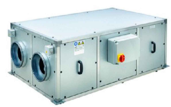
RECUPERADOR KOSNER KRC 3 ED BP PH SH (fuera de proyecto)