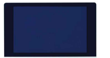
PANEL CONTROL KRV KOSNER CCM (fuera de proyecto)