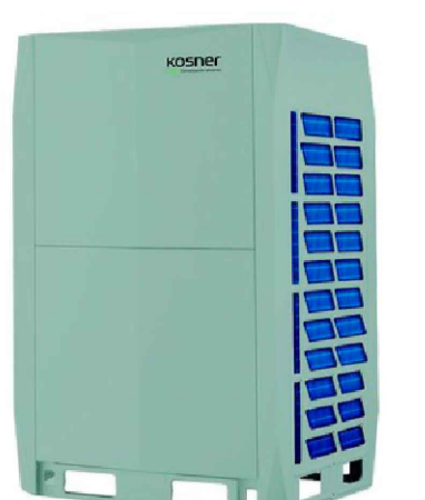
U. EXTERI. KRV DV INVERTER KOSNER 670W (fuera de proyecto)